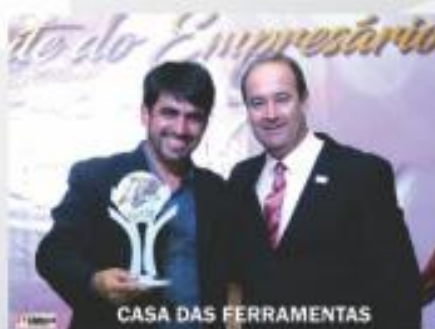
CASA DAS FERRAMENTAS