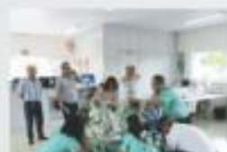
→ SORTEIO DA PROMOÇÃO NATAL DE OURO 2016