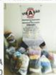
→ CAMPANHA DO AGASALHO