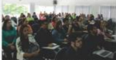
DISCUSSÃO SOBRE A REFORMA TRABALHISTA - IPECONT / SOMA CONTABILIDADE