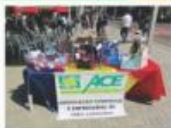
HOMENAGEM DIA DOS PAIS