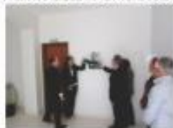
INAUGURAÇÃO AUDITÓRIO MILTON ANTÔNIO CORRÊA