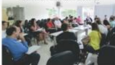
REUNIÃO BARES E RESTAURANTES