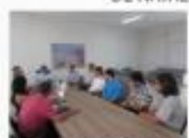
→ REUNIÃO SOBRE SEGURANÇA PÚBLICA