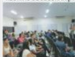
INÍCIO DA PROMOÇÃO DE NATAL