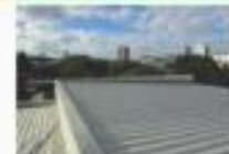
→ INÍCIO DA REFORMA DO TELHADO DA ACETC