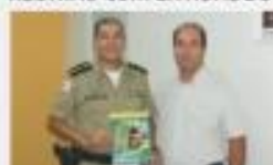
→ REUNIÃO COM COMANDANTE DA POLÍCIA MILITAR