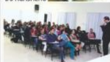
→ WORKSHOP ATENDA COM EXCELÊNCIA E VENDA MUITO MAIS