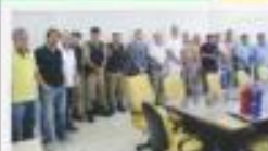
→ REUNIÃO SOBRE SEGURANÇA PÚBLICA