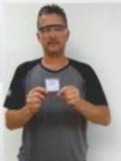
Cliente da Contransin