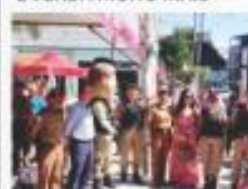
→ HOMENAGEM DIA DAS MÃES