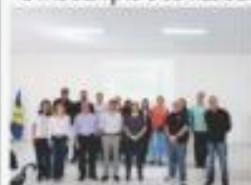
ENCONTRO GRUPO GESTÃO DE PESSOAS