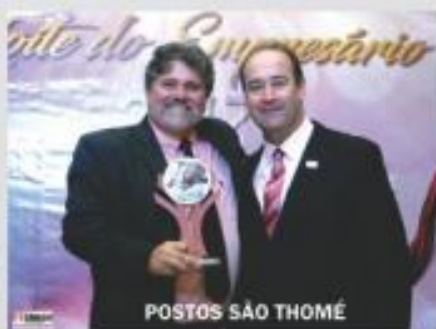
POSTOS SÃO THOMÉ