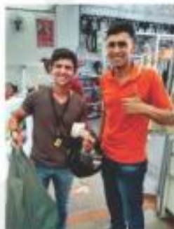
Cliente do Balcão dos Parafusos