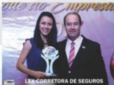
LEX CORRETORA DE SEGUROS