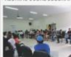
→ REUNIÃO BARES E RESTAURANTES