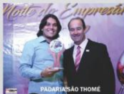
PADARIA SÃO THOMÉ