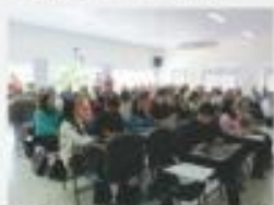
DISCUSSÃO SOBRE A REFORMA TRABALHISTA - IPECONT / SOMA CONTABILIDADE