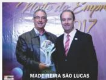
MADEIREIRA SÃO LUCAS