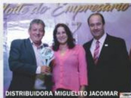
DISTRIBUIDORA MIGUELITO JACOMAR