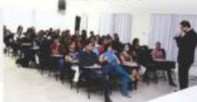
WORKSHOP ATENDA COM EXCELÊNCIA E VENDA MUITO MAIS