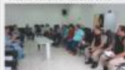
REUNIÃO DE SEGURANÇA PÚBLICA