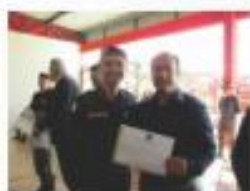
ACETC RECEBE HOMENAGEM DOS BOMBEIROS