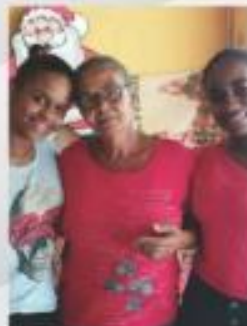
Cliente do Supermercado Cinturão Verde