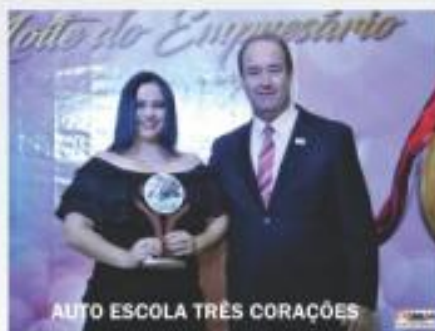
AUTO ESCOLA TRÊS CORAÇÕES