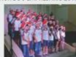
CANTATA DE NATAL