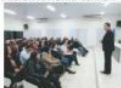
PALESTRA INTELIGÊNCIA FINANCEIRA