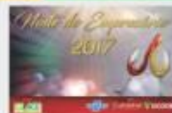
NOITE DO EMPRESÁRIO 2017