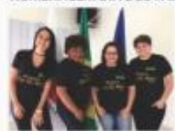
INÍCIO DA PESQUISA TOP OF MIND