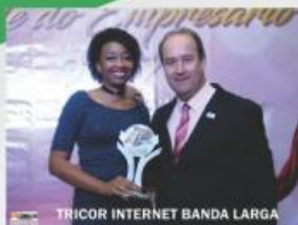
TRICOR INTERNET BANDA LARGA