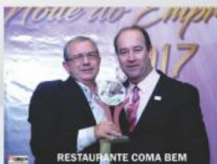
RESTAURANTE COMA BEM