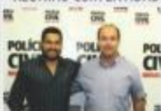
→ REUNIÃO COM DELEGADO DA POLÍCIA CIVIL