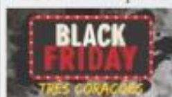
BLACK FRIDAY TRÊS CORAÇÕES