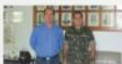
→ ACETC VISITA ESSA