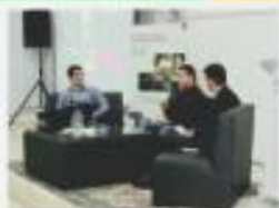
SEMANA DA MICRO E PEQUENA EMPRESA