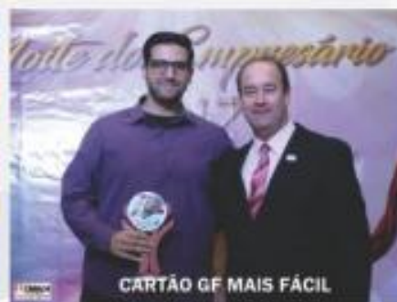
CARTÃO GF MAIS FÁCIL