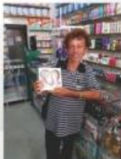
Cliente da Drogeria São Judas Tadeu