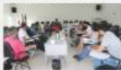
→ REUNIÃO COM ENTIDADE SÓCIO CULTURAL