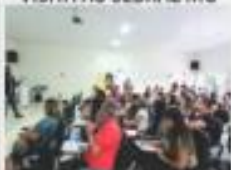
→ CONGRESSO PROFISSIONAL