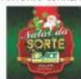
→ LANÇAMENTO DA PROMOÇÃO DE NATAL