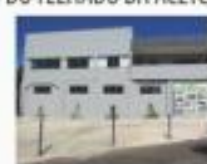
→ FASE FINAL DO AUDITÓRIO MILTON ANTÔNIO CORRÊA