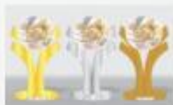
CONCLUSÃO DA PESQUISA TOP OF MIND E TABULAÇÃO DOS RESULTADOS