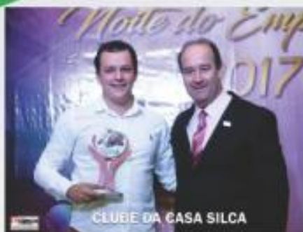
CLUBE DA CASA SILCA