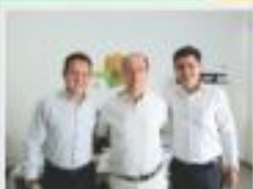
→ VISITA AO SEBRAE MG