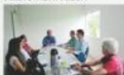
→ REUNIÃO DE REATIVAÇÃO DO CONSELHO DE DESENVOLVIMENTO