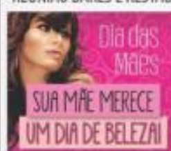
→ PROMOÇÃO DO DIA DAS MÃES