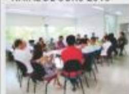
→ ELEIÇÃO E POSSE DA NOVA DIRETORIA