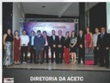
DIRETORIA DA ACETC