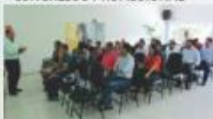
→ REUNIÃO COM ENTIDADES