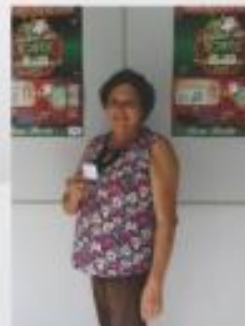
Cliente da Loja Zuza